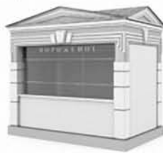
Возможные виды торговых объектов