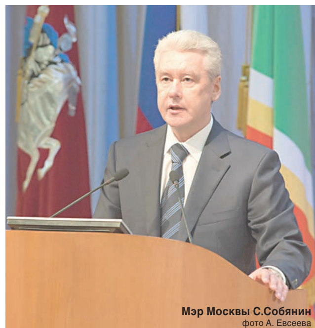
Мэр Москвы С.Собянин

высокотехнологичной промышленности, безусловно, должна сохраниться и в будущем. Зеленоград по-прежнему будет притягивать к себе высококвалифицированных специалистов. Здесь будет жить много молодых и активных людей. Они вправе рассчитывать на места в детских садах и хороших школах для своих детей, на комфорт и качество лечения в больницах и поликлиниках, на устойчивую работу общественного транспорта, на чистый воздух и разнообразные возможности для отдыха и занятий спортом. Только такой подход позволит компенсировать нашей молодежи, да и всем жителям округа объективные неудобства проживания за пределами основной территории столицы.