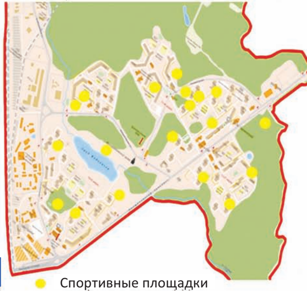
● Спортивные площадки