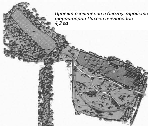
Проект озеленения и благоустройства территории Пасеки пчеловодов 4,2 га

Общая площадь благоустройства 4,2 га, которая включает в себя территорию пасеки (0,8 га) и территорию, прилегающую к Чудинову пруду. Общая стоимость реализации проекта составляет 20 млн рублей.