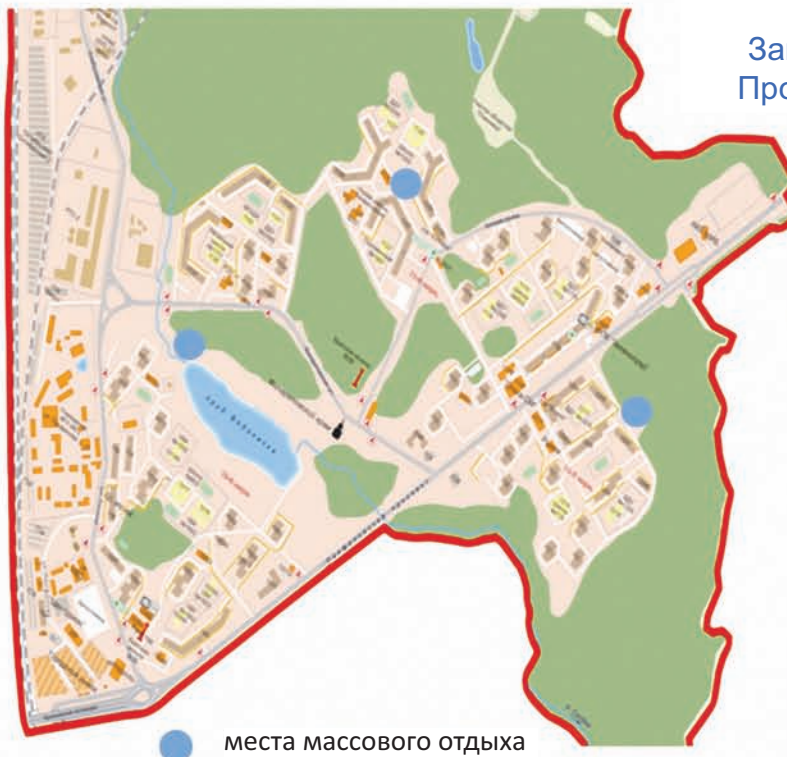
места массового отдыха

Развитие мест массового отдыха Запланировано к развитию в 2011-2012 г. Проектирование – 2011 г., работы – 2012 г.