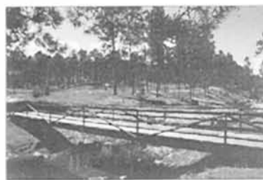
Мост через реку

На территории предусматриваются: - устройство дорожно-тропиночной сети - устройство площадки для отдыха взрослых - установка МАФ (урны, скамьи, моста)